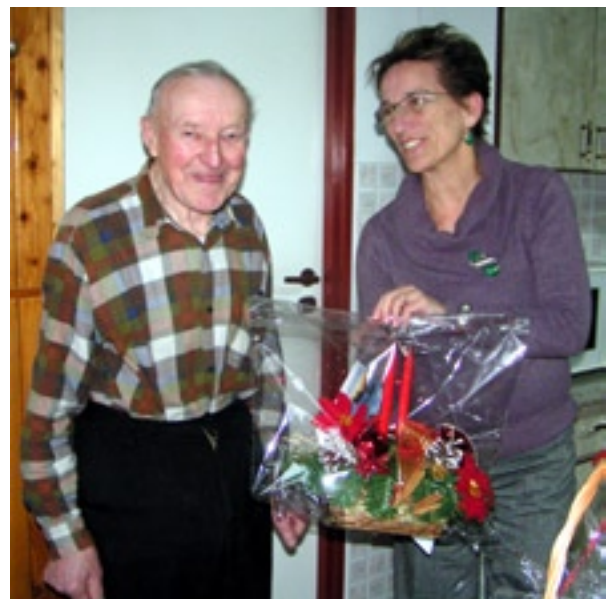
■ fot. Lesława Wrnek