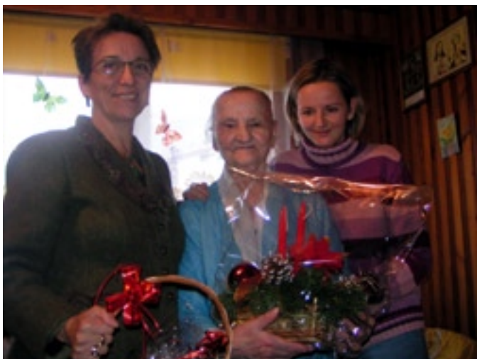
■ fot. Lesława Wrnek