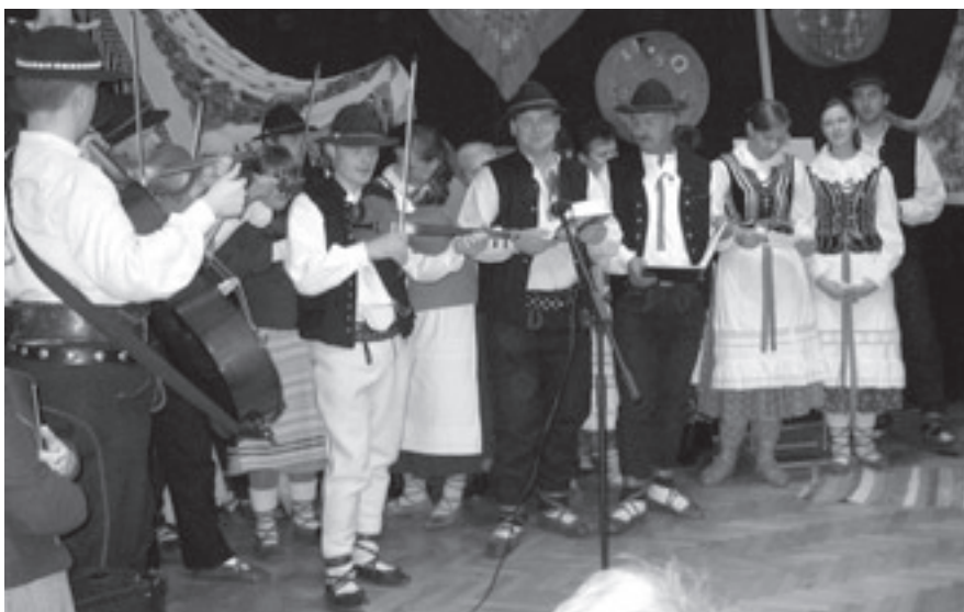
Regionalny Zespół "Dolina Popradu"