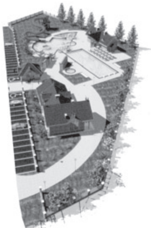
Projekt kąpieliska w Łomnicy