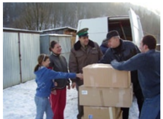
Mikołajowe paczki dostarczyli pogranicznicy