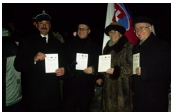
Każdy otrzymał pamiątkowy certyfikat "wolnego obywatela" poświadczający uczestnictwo w imprezie.