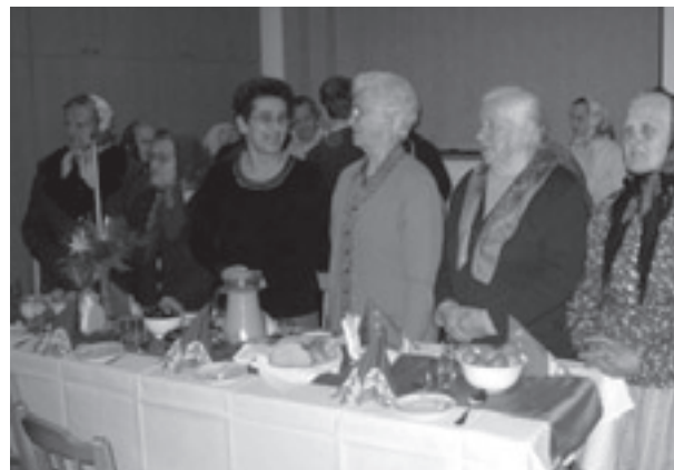
Kolędowanie sprawiło wiele radości