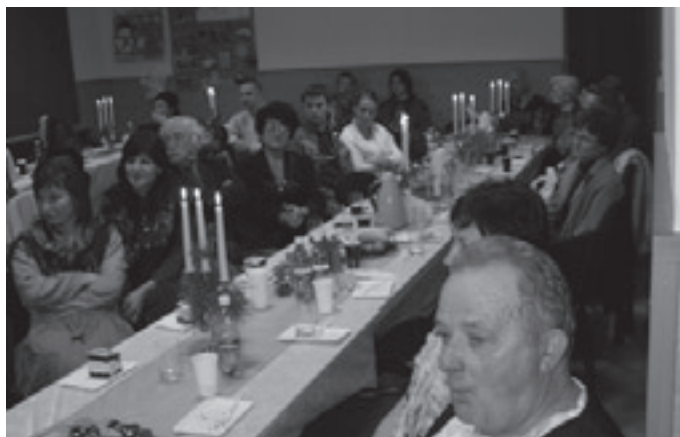
Występom artystów przyglądali się licznie przybyli goście