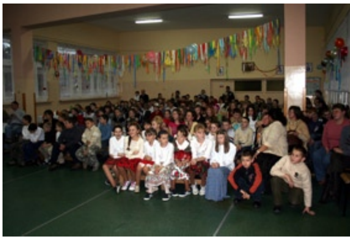
Pamiątkowe zdjęcie uczestników balu

Tradycją stały się już karnawałowe spotkania integracyjne podopiecznych 7- miu świetlic profilaktyczno-wychowawczych działających przy szkołach na terenie miasta i gminy Piwniczna – Zdrój. 19 stycznia br. w sobotnie popołudnie, w świetlicy Szkoły Podstawowej Nr 1 w Piwnicznej – Zdroju odbyła się zabawa integracyjna, w której uczestniczyło ponad 200 dzieci i młodzieży wraz z opieką pedagogiczną organizatorami i zaproszonymi gośćmi. Celem spotkania było pokazanie jak można zdrowo, pożytecznie i radośnie bawić się, a jednocześnie w zabawie zaprezentować dorobek artystyczny poszczególnych zespołów świetlicowych.