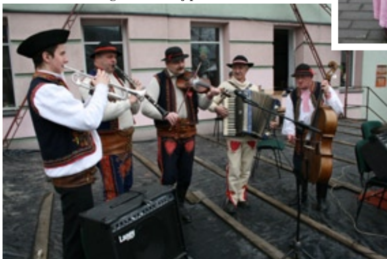
Zebrany przygrywała kapela regionalna