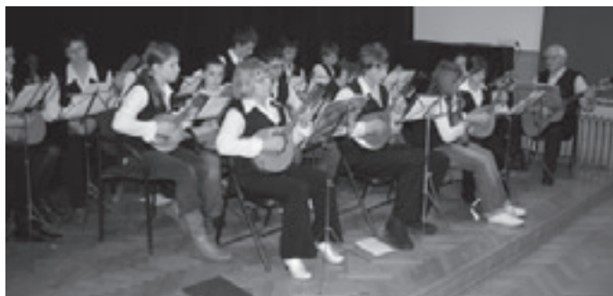
Spotkanie uświetnił kwintet mandolinowy