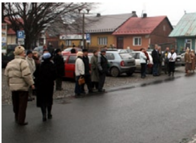
Licytowane przedmioty znalazły wielu nabywców wśród zgromadzonej publiczności.