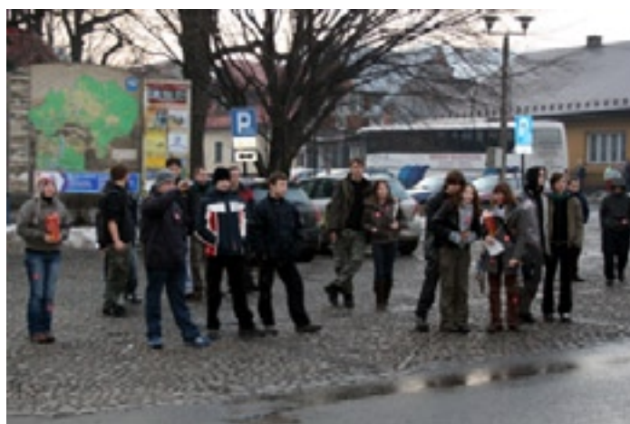
... który zgromadził wielu fanów.