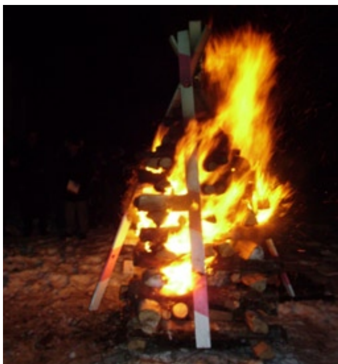
Symboliczne szlabany spłonęły w ognisku