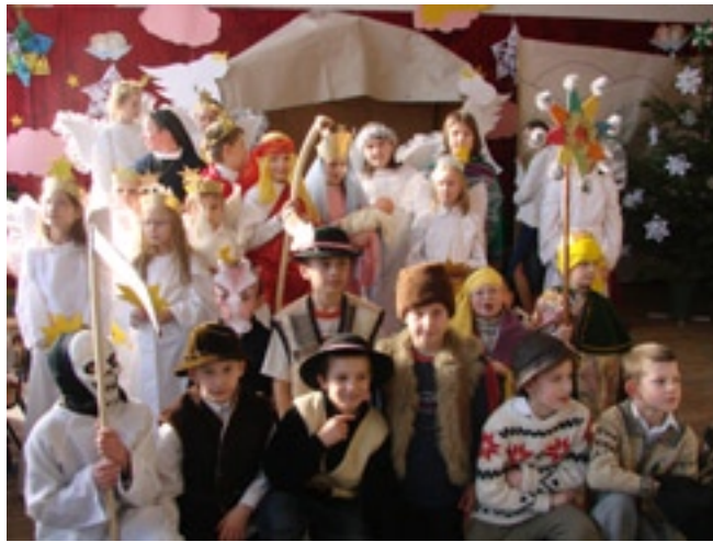
Wigilijne spotkanie sprawiło dzieciom wiele radości

S ą takie daty, które w kalendarzu Polskim mają szczególne znaczenie. Wiążą się z przekazywanymi z pokolenia na pokolenie zwyczajami.