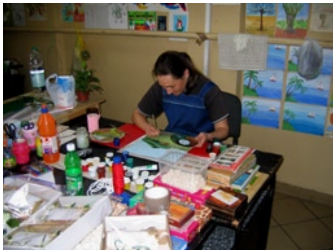
Warsztaty rzemiosła artystycznego

ewentualnym pracodawcą, jak stworzyć w pracy miłą atmosferę. Potem, każdy odbywa przez rok konkretne szkolenie, dające umiejętności praktyczne i wiedzę teoretyczną. W nowosądeckim STOPILU panuje przyjaźń i życzliwość. Osoby tam pracujące są chętne do pomocy i fajnie we współdziałaniu.