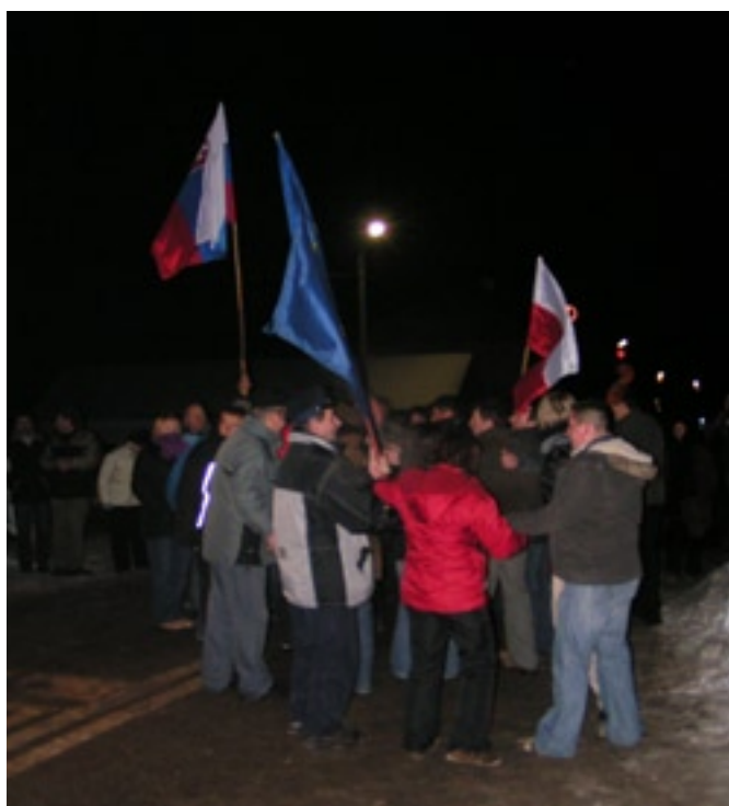
Mieszkańcy Piwnicznej i Mniszka wspólnie świętowali otwarcie granic