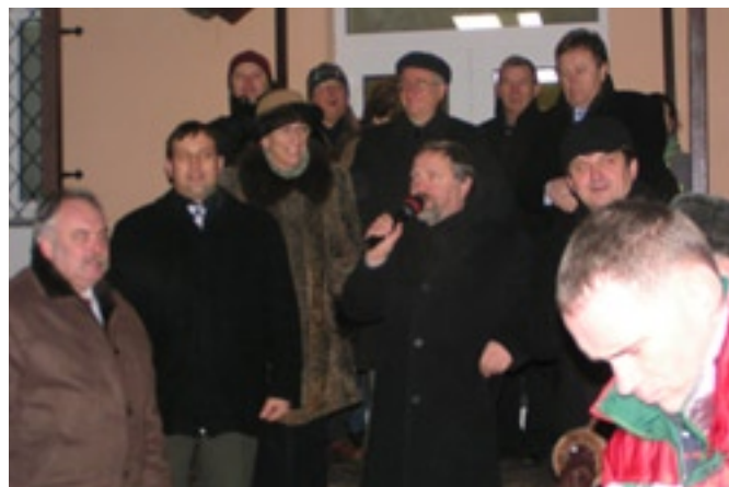
Przedstawiciele lokalnych władz wygłosili krótkie przemówienie.