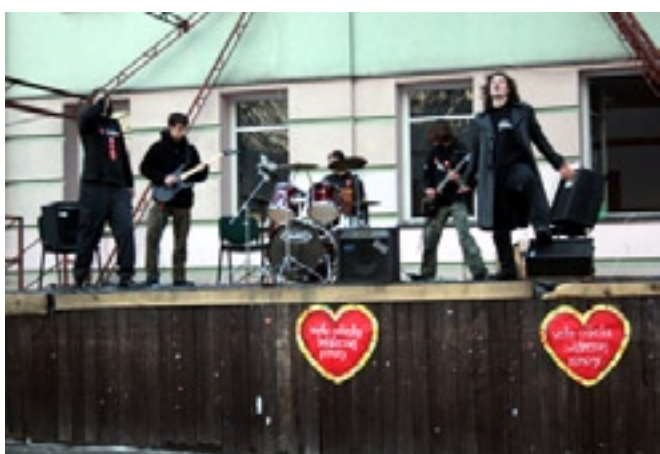
Na scenie wystąpił m. in. młodzieżowy zespół muzyczny Tenabrae...