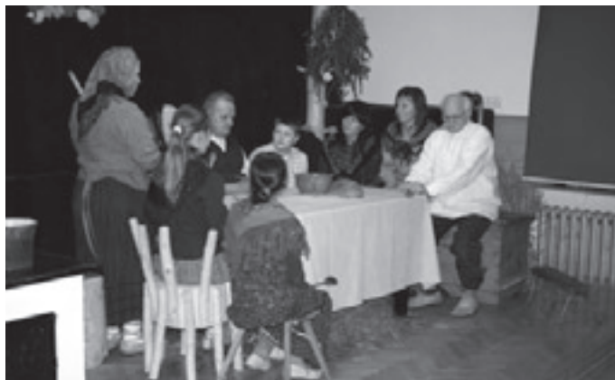
Amatorski zespół teatralny z Łomnicy odtworzył wieczerzę wigilijną wg starych obyczajów