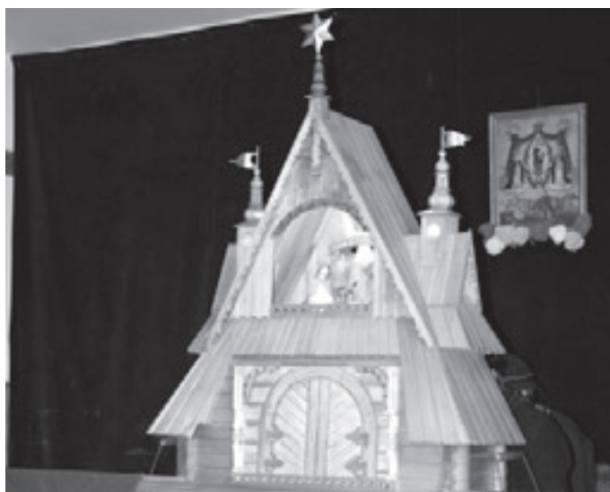
Szopka wykonana przez Edwarda Grucelę