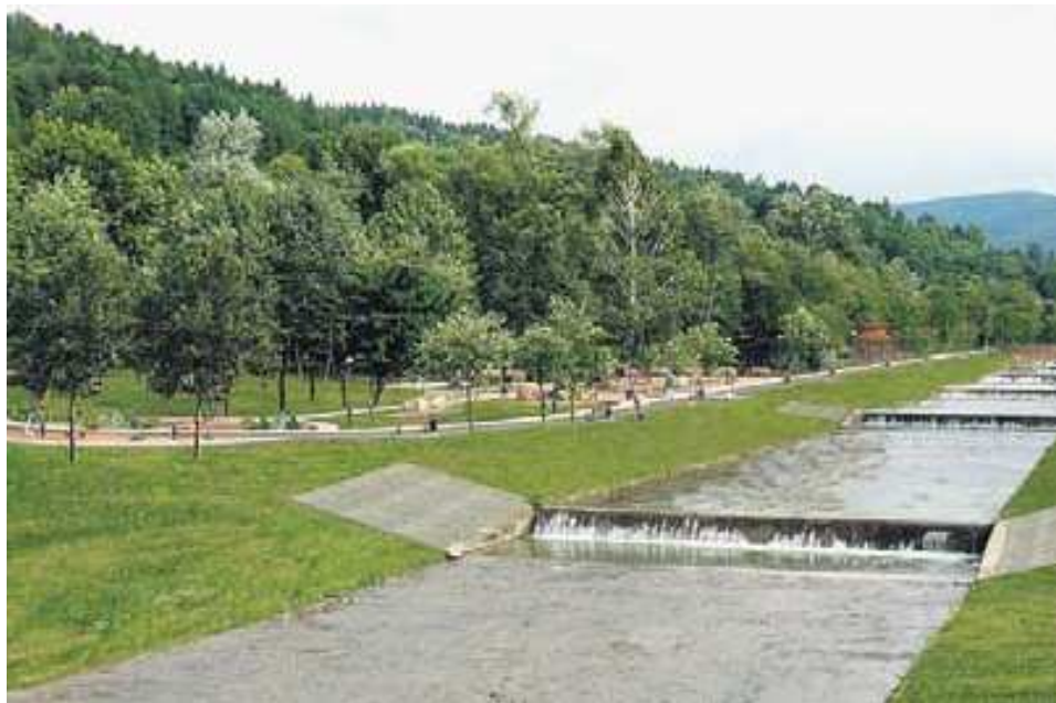
WIZUALIZACJA BIURA PROJEKTOWEGO ARCHIMEGA

Całe przedsięwzięcie parkowe rozłożono na trzy etapy. W zeszłym roku zainstalowano już oświetlenie głównego punktu parku – ruin wiekowej baszty. Wybudowano również trzy kładki pieszo-rowerowe na potoku Szczawnik.