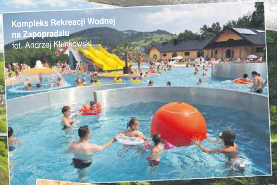
Fala termiczna