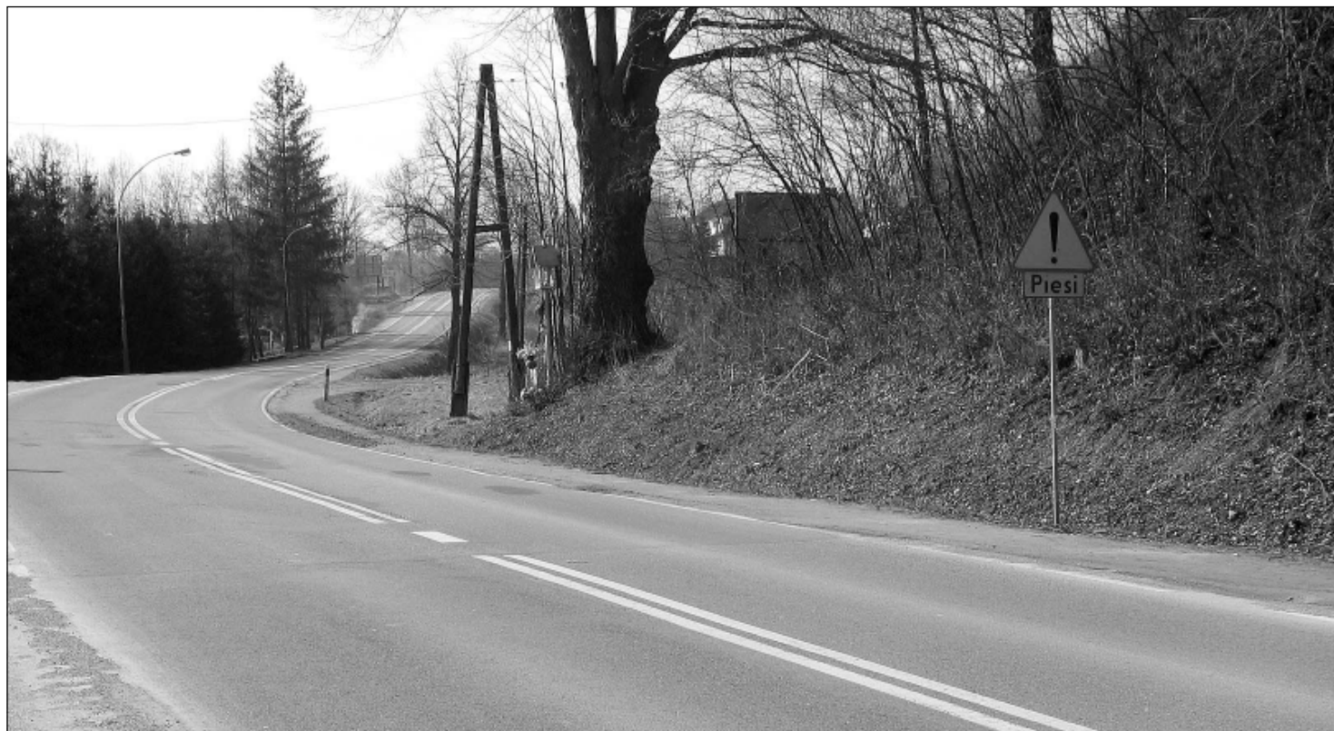
Znak ostrzegawczy i kapliczka - tylko te elementy jak na razie dodają poczucia bezpieczeństwa pieszym wchodzącym na pobocze ul. Krakowskiej.

INFORMATOR LIMANOWSKI Informacje Urzędu Miasta Limanowa, Wydawca: Urząd Miasta, Teksty: Jolanta Szyler, Anna Kądziołka, Roman Limanówka. Adres do korespondencji: Urząd Miasta-Wydział Promocji, Integracji Europejskiej, Kultury i Turystyki; ul. Jana Pawła II 9, 34-600 Limanowa; tel. /0-18/ 337-20-54 wew. 44 i 47, e-mail: uml@pro.onet.pl