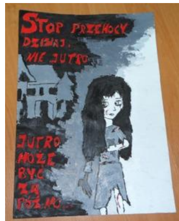
Wykonała: Karolina Chmiel

Dziękujemy wszystkim osobom zaangażowanym w organizację konkursu za pomoc w realizacji przedsięwzięcia!