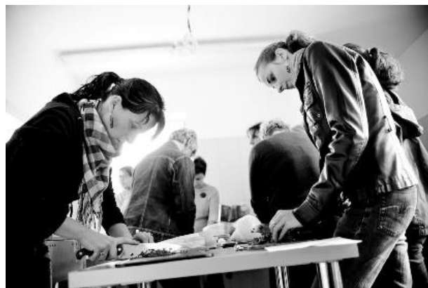
Fot. Jarosław Nogal