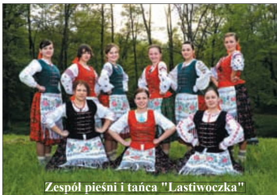
Zespół pieśni i tańca "Lastiwoczka"