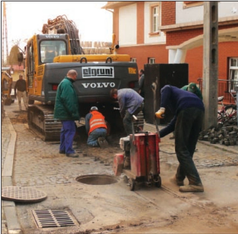
Pierwszy etap budowy kanalizacji obejmuje centrum Imielina.

Od kilku miesięcy Imielin stał się placem budowy. Trwają prace przy wykonywaniu kanalizacji i oczyszczalni sanitarnej.