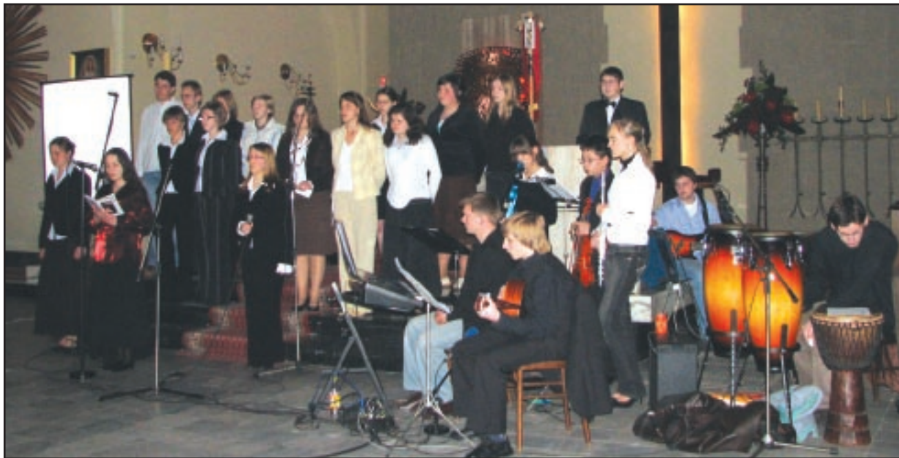
Zespół „Faradajs” wystąpił w hołdzie Papieżowi

Pod tytułem „Miłość ci wszystko wyjaśniła” 29 kwietnia odbył się w kościele pw. Matki Boskiej Szkaplerznej koncert w wykonaniu zespołu parafialnego „Faradajs”.