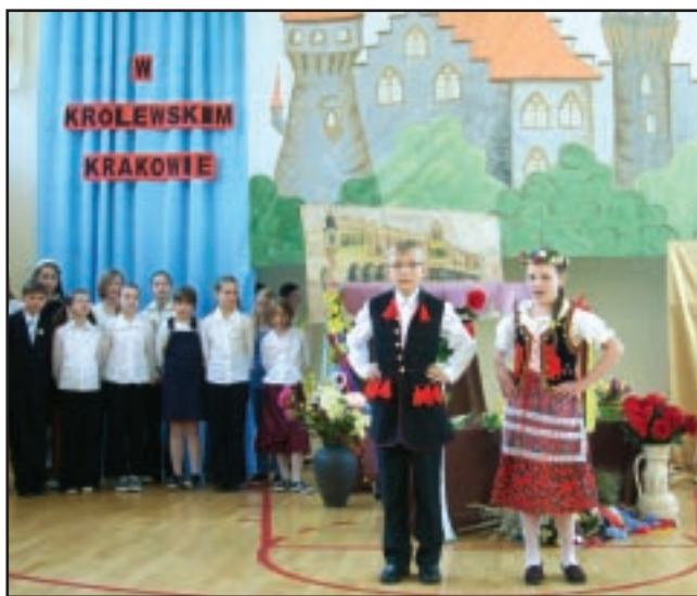
W konkursie I miejsce zdobyli uczniowie z Imielina

Pod takim hasłem odbyła się w kwietniu w Szkole Podstawowej, VII edycja Powiatowego Konkursu Przyrodniczego „Świat Przyrody”. W konkursie uczestniczyli uczniowie z 8 szkół podstawowych powiatu