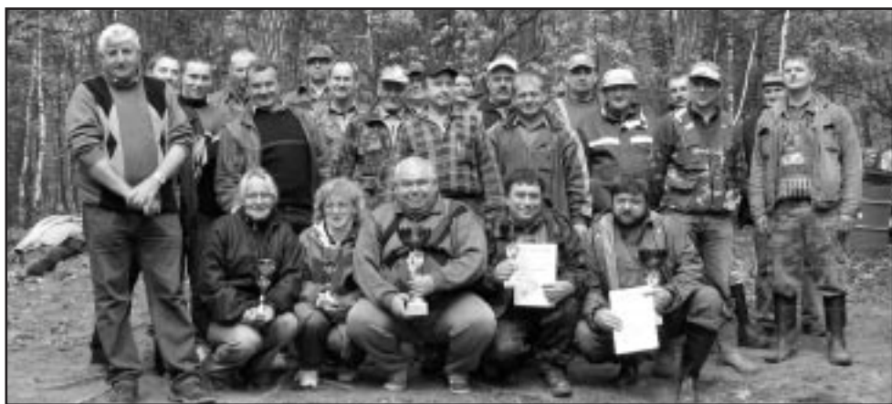
Imielińscy wędkarze zainaugurowali nowy sezon.