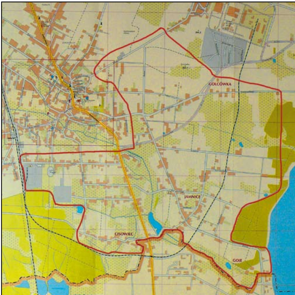
Czerwoną linią wyznaczono przybliżony obszar, który obejmie kanalizacja. Są to Golcówka, Jamnice i Cisowiec.

Za pieniądze z Unii Europejskiej i z budżetu miasta do miejskiej oczyszczalni w tym etapie zostaną podłączone: