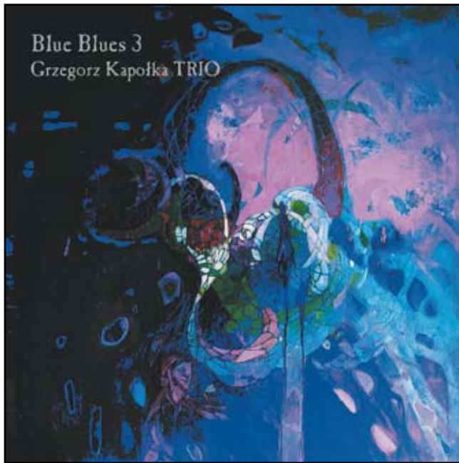
Okladka najnowszej płyty Grzegorza Kapołki pt. Blue Blues III, która ukazuje się jeszcze w październiku

- Kto jest Pana muzycznym mistrzem, komu zawdzięcza