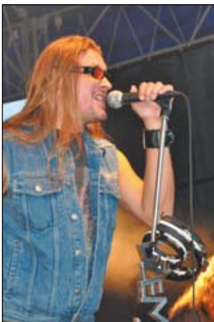
Zespół Dżem przyciągnął tłumy

16.00. W przerwach zawodów zaprezentowały się mażoretki „Gracja”. Wieczorem, po wręczeniu pucharów, medali i nagród biegaczom, zagrał zespół „Strefa” i gwiazda wieczoru zespół „Dżem”.