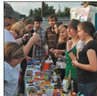
Harcerze zbierali dla chorego

- W akcję zaangażowanych było kilkadziesiąt osób. Przygotowywaliśmy ją od 3 tygodni. Wykonaliśmy figurki z masy solnej i z gipsu, malowaliśmy i rzeźbiliśmy krzyże.