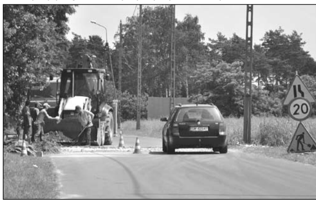
Prace przy progu zwalniającym przy ul. Wandy

- Ten rodzaj spowolnienia ruchu zastosujemy na razie pilotażowo na 2 ulicach. Opinie mieszkańców zdecydują, czy będziemy je również instalować w innych miejscach niebezpiecznych dla pieszych – powiedział nam burmistrz. (zz)