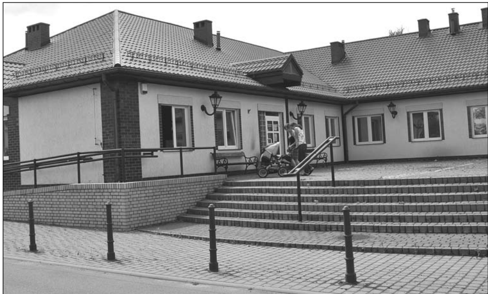
Imieliński ośrodek zdrowia nie miał dotąd kłopotów finansowych

Do tej pory byliśmy zakładem publicznym i nie mieliśmy zadłużenia. A przekształcenia w służbie zdrowia dokonują się w zakładach zadłużających się. Przed prywatyzacją powinniśmy odpowiedzieć sobie na pytanie, czemu ma ona służyć, co chcemy przez nią osiągnąć? Z mojego punktu widzenia ona niewiele zmienia.