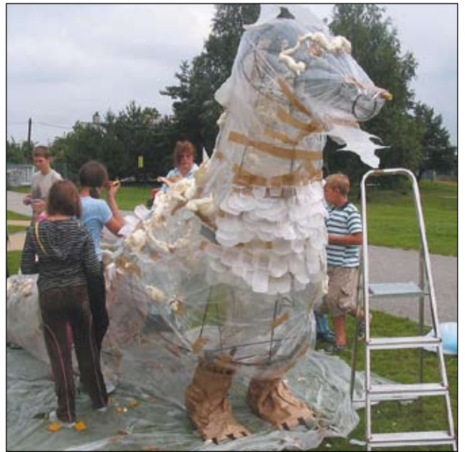
Dzieci podczas tworzenia wakacyjnego smoka