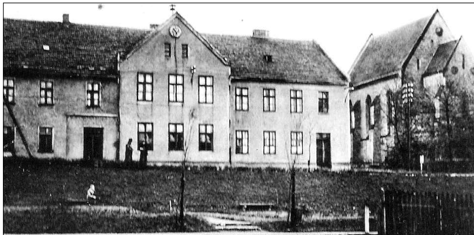
Budynek starej szkoły imielińskiej w 1940 roku, obok kościoła

W miejscu, gdzie obecnie stoi kościół i szkoła czyli „na górze”, był teren dawnego folwarku imielińskiego. Znajdował się tam browar, spichlerz, obo-