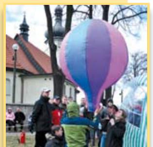
Balony pod Klimontem