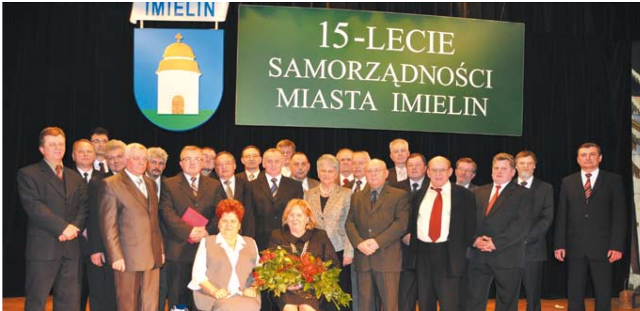
Radni czterech kadencji imielińskiego samorządu - od roku 1995.