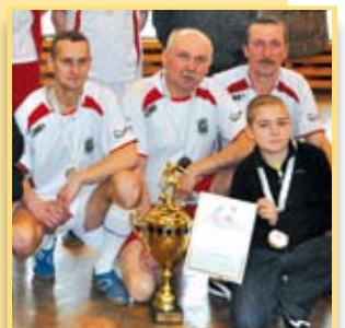
Po raz trzeci na podium