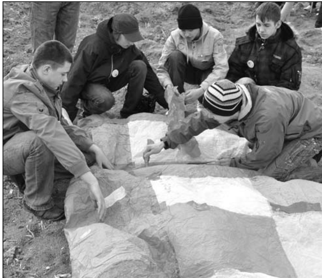
Na Klimoncie nawet sklejanie nie pomogło na porywisty wiatr.

Oprócz szybowców w Sokolni można poprobować również puszczanie balonów. Ogromne czasze wykonane z kawałków różnokolorowej bibułki wypełnia się nagrzanym powietrzem. Wówczas unoszą się w powietrzu dotykając sufitu, by po chwili opaść na ziemię. W ostatnią sobotę marca podczas zwozów balonów na lędzińskim Klimoncie jest inaczej. Porywisty wiatr utrudnia