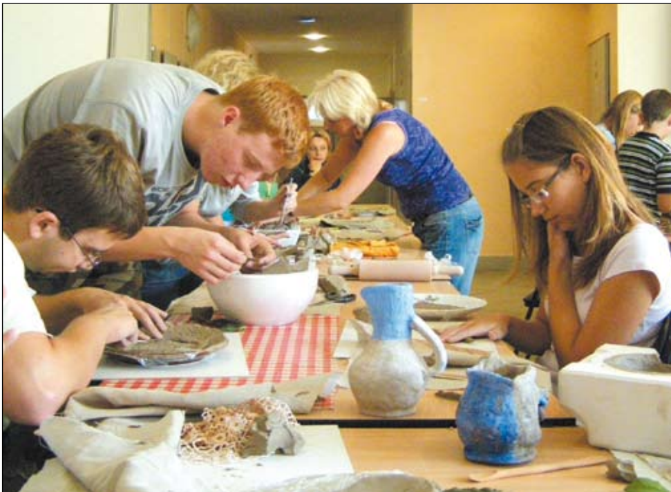
W Sokolni odbyły się warsztaty ceramiczne, podczas których kształtowano nie tylko glinę.

W ostatni wakacyjny dzień na półkoloniach jak od kilku lat odbył się kiermasz zorganizowany przez Społeczne Hospicjum Cordis w Mysłowicach. Oferowane były różne przedmioty, wyroby i ozdoby wykonane przez personel, wolontariuszy i samych chorych z Hospicjum. Jak co roku nasi