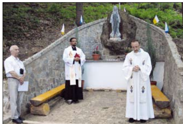
Uroczystość poświęcenia figury Matki Boskiej w Szczyrku.

Uczestnikom zapewniono nie tylko przejazdy i wstęp do zwiedzanych miejsc, ale i całodzienne wyżywienie oraz lody. Fundusze na ten cel zostały zebrane podczas festynu Farskie Ogrody. (zz)