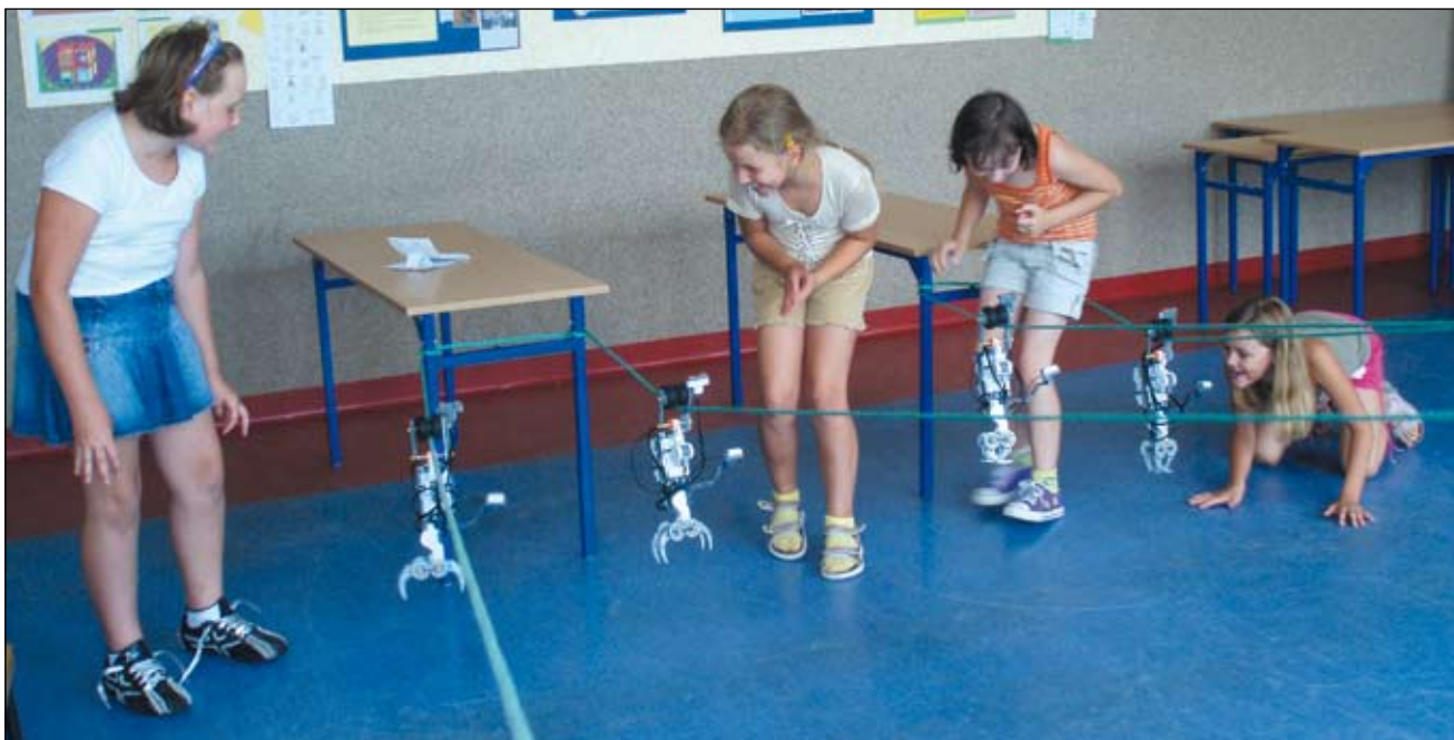
Na zajęcia w szkole podstawowej przygotowano atrakcyjny program (zdjęcie u góry i na dole), w którym każdy znalazł coś dla siebie.

przychodzi, by zobaczyć, jak od podstaw można stworzyć coś fajnego.